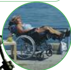
Assise inclinable avec verins

3 largeurs d'assise : 39-44-49 cm Profondeur d'assise : 43 à 50 cm Poids maxi utilisateur : 135 Kg Poids à partir de 35 Kg