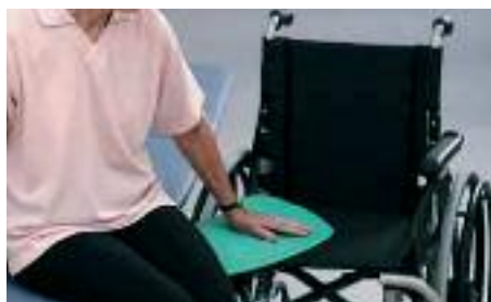
Planche de transfert incurvée

Cette planche en matériau plastifié de haute densité vous apporte solidité et glisse nécessaire pour réaliser vos transferts dans les meilleures conditions. Sa forme en arc de cercle est idéale pour les transferts d'assise à assise et ses extrémités à butée vous permettent de la sécuriser contre des montants de chaises ou de porte de voiture.