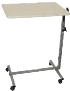
Table de lit réglable pied en U

Robuste et maniable. Hauteur et inclinaison du plateau réglables (lecture, écriture, repas). Plateau à rebords pour éviter la chute des objets. Ref. : 421000