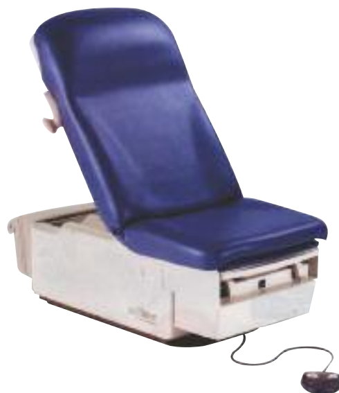
Table d'examen Ritter 222

* précisez le coloris souhaité lors de votre commande