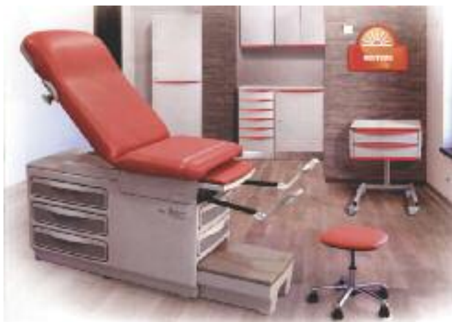
Table d'examen Ritter 204